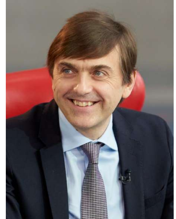
Министр просвещения РФ Сергей Кравцов

Следующее направление – современная инфраструктура, созданная в том числе в рамках национального проекта «Образование». Строятся и ремонтируются школы и детские сады, в также открыты 79 региональных центров, работающих по модели «Сириус», открыто более 250 центров «IT-куб», 365 технопарков-кванториумов, а также более 17 тысяч центров образования цифрового, естественнонаучного, технического, гуманитарного профиля «Точки роста».